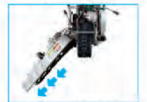
側面の刈幅が350~670mm まで4段階調整できます。