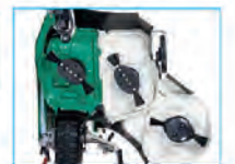
フリーナイフ仕様