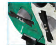
ダブルナイフ仕様